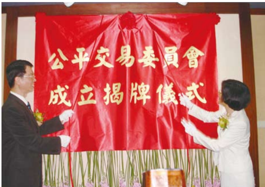
◀ 公平會吳主任委員與羅政務委員瑩雪共同主持揭牌儀式。