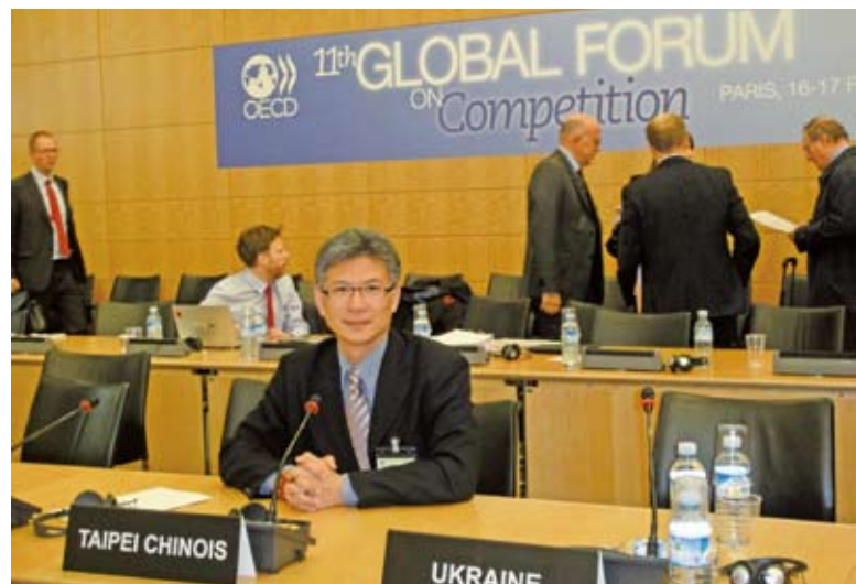
▶ 公平會孫委員立群出席OECD「競爭委員會」例會及第11屆「全球競爭論壇」