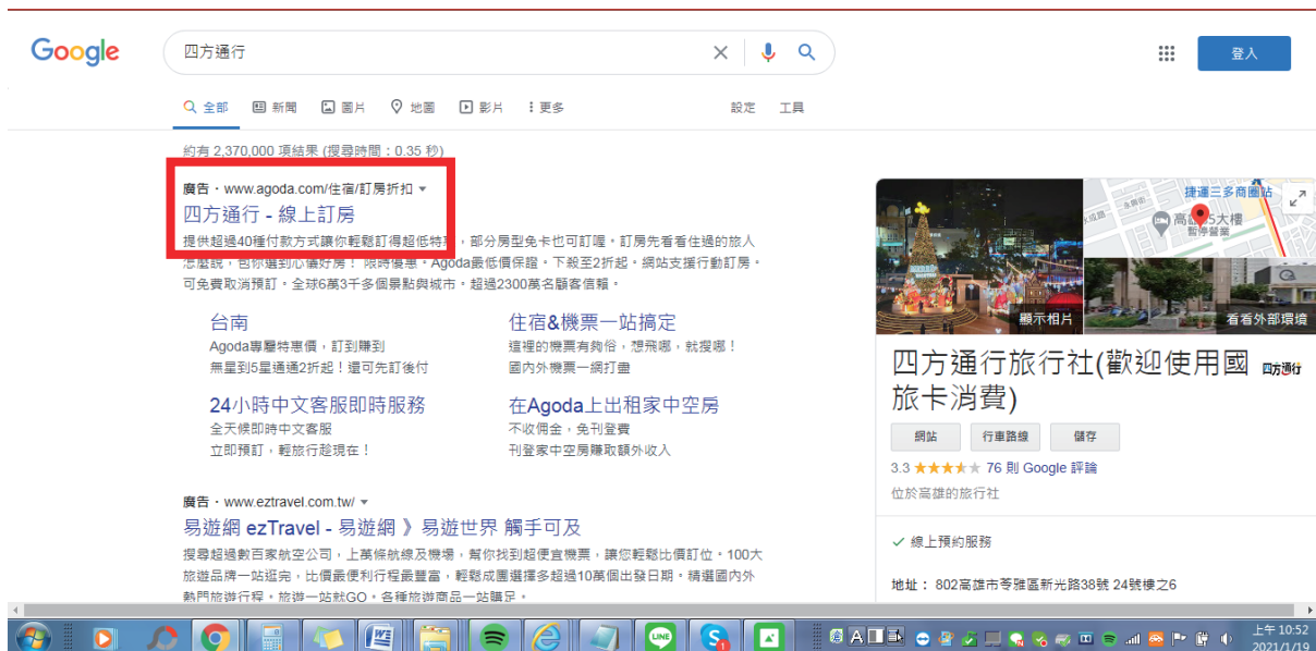
本案關鍵字廣告之網頁資料