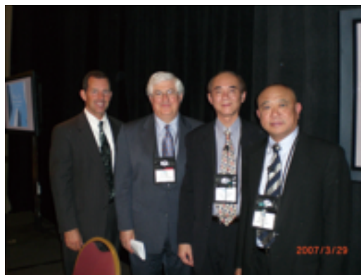
余副主任委員出席2007年直銷國際研討會，與與會貴賓合影

美國直銷協會（DSA）日前透過世界直銷聯盟（WDSA）邀請公平會副主任委員余朝權博士赴美參加該協會本（96）年3月27日至29日於華盛頓特區所舉辦之2007年直銷國際研討會；余副主任委員朝權並於3月28日之會議中，上台講述台灣現階段積極規劃建立之多層次傳銷事業評鑑制度，並與世界各國之傳銷業界代表及研究學者進行國際交流