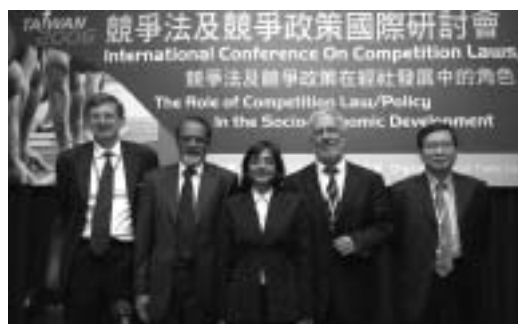
95年6月20日「台灣2006競爭法及競爭政策國際研討會」第2場次主持人及論文發表人。由左至右分別為：美國聯邦交易委員會競爭局助理局長阿登·艾伯特、WTO智慧財產部門顧問皮耶·雅赫、南非競爭法庭委員雅斯敏·卡琳、德國卡特爾署副署長彼得·克拉克及寶華綜合經濟研究院院長梁國源。