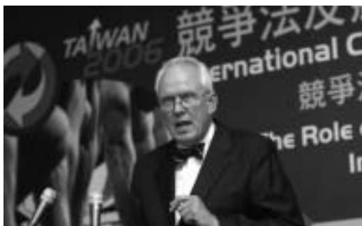
德國馬普研究所所長兼德國獨占委員會主任委員約根·貝斯多教授以「市場管制政策及相關法令」為題於95年6月20日「台灣2006競爭法及競爭政策國際研討會」發表專題演講。