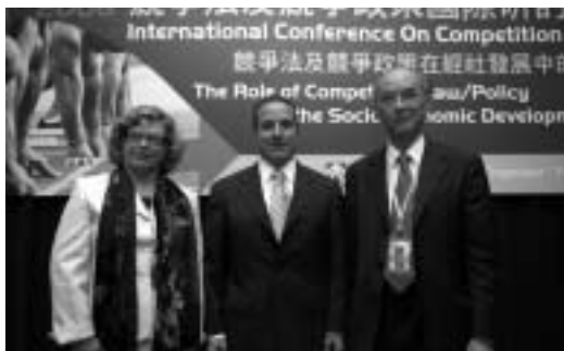
95年6月20日「台灣2006競爭法及競爭政策國際研討會」競爭法主管機關代表演講。由左至右分別為：紐西蘭商業委員會主任委員寶拉·雷博斯多克、美國司法部反托拉斯署副署長葛瑞德·馬紹迪及公平會副主任委員余朝權。