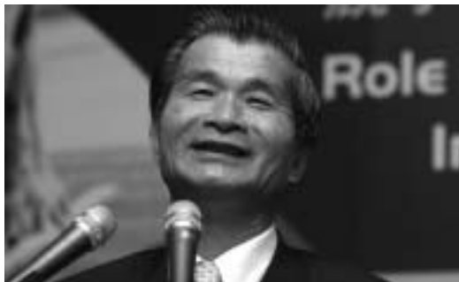
公平會主任委員黃宗樂於95年6月20日「台灣2006競爭法及競爭政策國際研討會」開幕式致詞。