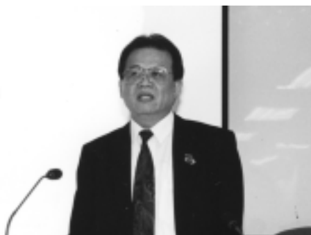
美國小布希總統宣示反恐戰爭的整

合戰備過程中，一項重要的工作是祭出 1996 年及 1998 年「國家緊要基礎建設 (national critical infrastructure)」兩個重要法案，使成為反恐行動方案的一項重要工作。美國「國家緊要基礎建設」或所謂「國家臨界基礎建設」的四大領域之首，是 ITS，因為此次反恐作戰，而引起各國政府的極高度重視。由於 ITS 是最近十多年來國際間崛興的嶄新領域，很多想法與作法，尚未為世人所普遍周知，希望今天的報告能讓各位瞭解，這一個新領域的發展，及其所面對的問題。